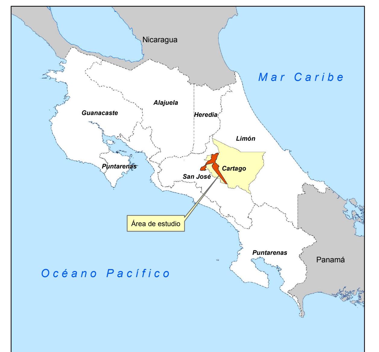
Diagrama de Ubicación