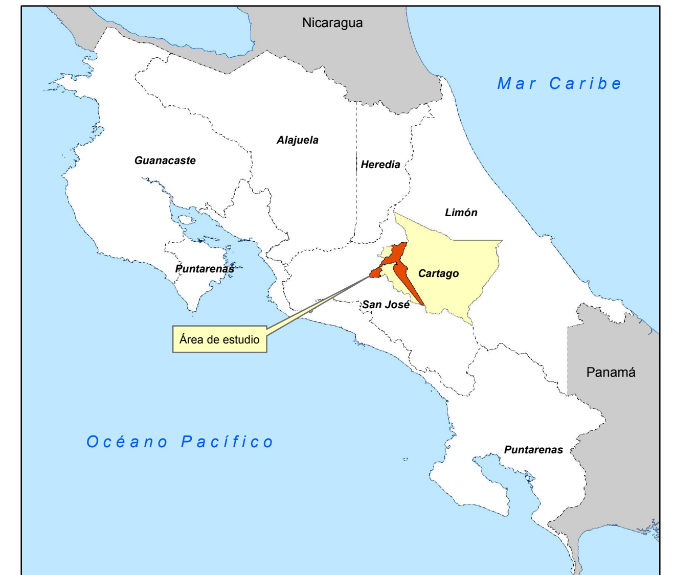
Diagrama de Ubicación