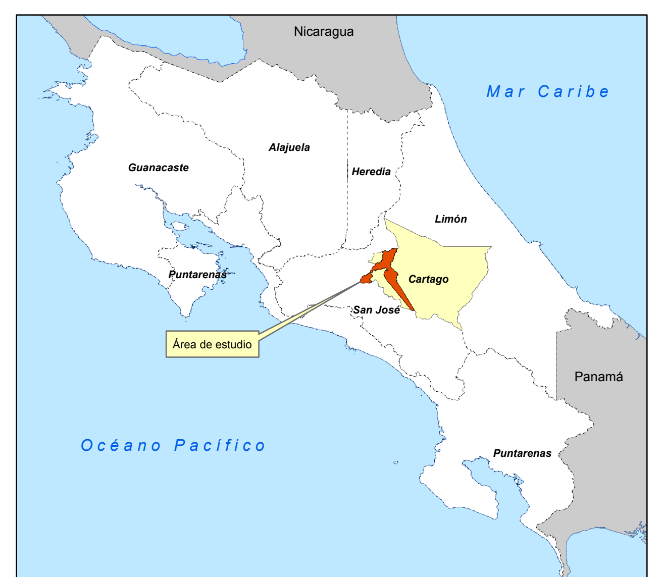
Diagrama de Ubicación