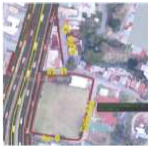
Figura 3. Redireccionamiento de ciclorruta.

6 7 8 9 10 11 En el sector desde la avenida 9, el proyecto en ejecución genera una desviación 12 de la ciclorruta, teniendo en cuenta que sobre el sector de la cancha hay un 13 paradero de bus que no permite por espacio la continuidad de esta y esta pasa 14 por la Calle 50A, Avenida II y Calle 52,