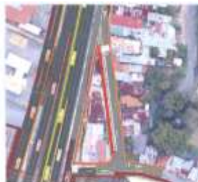
Figura 4. Propuesta de los parques.

15 16 17 18 19 20 Combinado las necesidades del proyecto se contempla la proyección de un 21 tráfico unidireccional en sentido Sur- Norte con la proyección de 14 espacios 22 de parqueo Longitudinales de dimensiones 2,50 x 6,00 metros cada uno, 23 manteniendo la ciclorruta según diseño inicial y una acera de 1,20 a 1,40 metros 24 por el costado oriental.