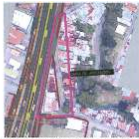
Figura 2. Estado previsto y proyectado.

1 El diseño inicial del proyecto Taras-La Lima contempla, la ampliación del troco 2 principal a seis (6) carriles, tres en cada sentido, acompañados por dos (2) 3 calzadas marginales, de las cuales, la marginal izquierda genera una afectación 4 a la Avenida 52 y el proyecto contempla su respectiva conexión con los 5 remanentes de esta.