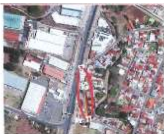
Figura 1. Ubicación de la Unidad Supervisora del Proyecto. Unidad Supervisora 2022.